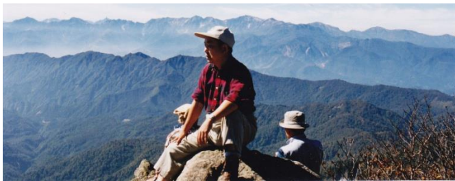
高妻山山頂にて 1999年10月 (58歳)