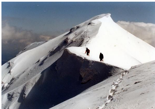
剣ヶ峰へ トレース 写真撮影：1983. 2. 27

冬の大山は極寒の世界だ。厳冬期に何度か大山に登ったが、雪稜を縦走中、突然、目の前の雪庇が割れて表層雪崩になって落ちていった。生きた心地がしなかった。冬の大山、慎重に用心！用心！