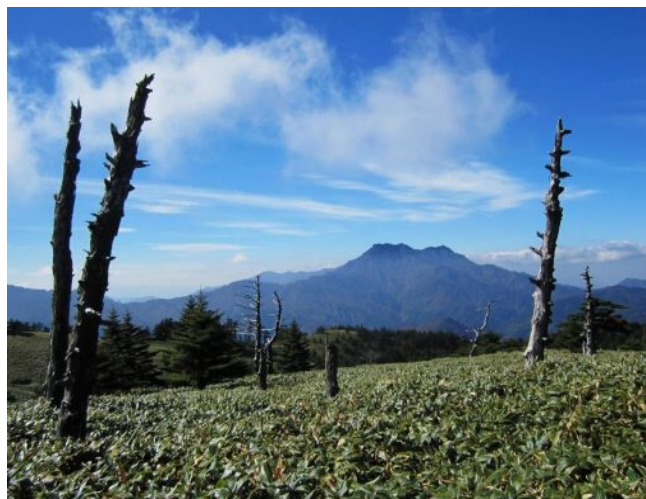
白骨樹間に垣間見る 撮影：2012. 10. 24

笹一面に敷きつまつまれた瓶ヶ森。白骨樹が乱立してエキゾチックな光景を呈していた。白骨の樹間から垣間見る石鎚山は、いかつく武骨だった。