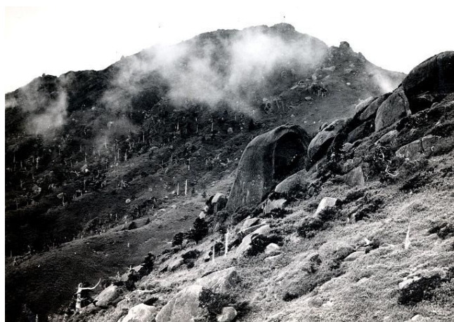
屋久島の最高峰 撮影：1966. 5. 6

テントや食料など 25 キロのリュックを担いで、海拔ゼロの安房港から宮之浦岳を踏む屋久島縦断に挑んだ。二日かかりで山頂に立って、東支那海や太平洋を見下ろした。その夜は花ノ江河で野営をしたが、夜半から激しい雨に降られた。翌日も雨は降り止まずスコールのような雨の中、不明瞭な悪路を歩いて、湯泊の海岸へ下山した。思わず救われた心地だった。