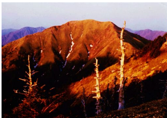
剣山 1955m の山頂から 撮影：1978. 5. 1

早朝、剣山の頂上に立った。その日は快晴で、瀬戸内海・紀伊水道・太平洋が一望にあった。そして目の前には、朝日に照らされた次郎笈が美しく横たわっていた。