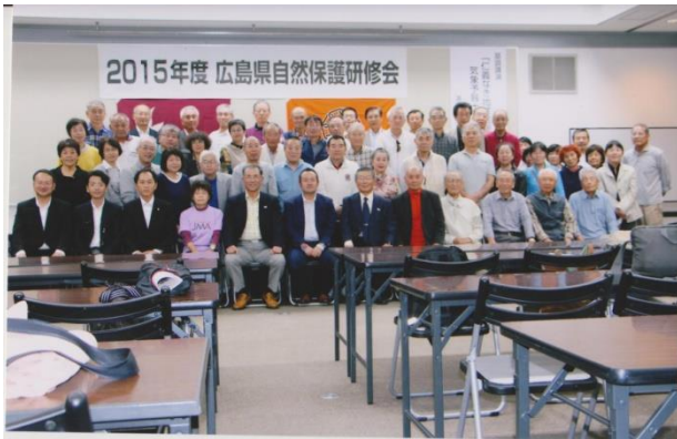
2015・10・17 西区民文化センター