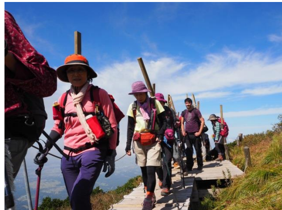
栈木を運ぶ風景 2015・8・11