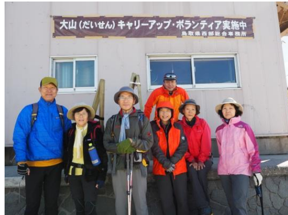
山頂にて山岳連盟の仲間と 2015・8・11