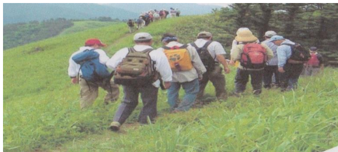
県民ハイキング 一緒にハイキングしませんか

山岳連盟は、広報活動・募集・保険の加入を担当する。担当団体は、山行計画書その他の作成・当日の引率を担当する。