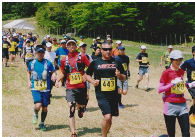
写真は第 22 回比婆山スカイラン 2014・5・18 撮影