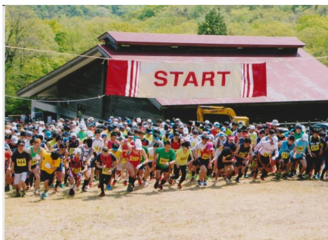
写真は第 22 回比婆山スカイラン 2014・5・18 撮影

(一社) 広島県山岳連盟 〒733-0011 広島市西区 横川町 2 丁目 4-17 TEL/FAX082-296-5597 比婆山国際スカイラン 大会事務局