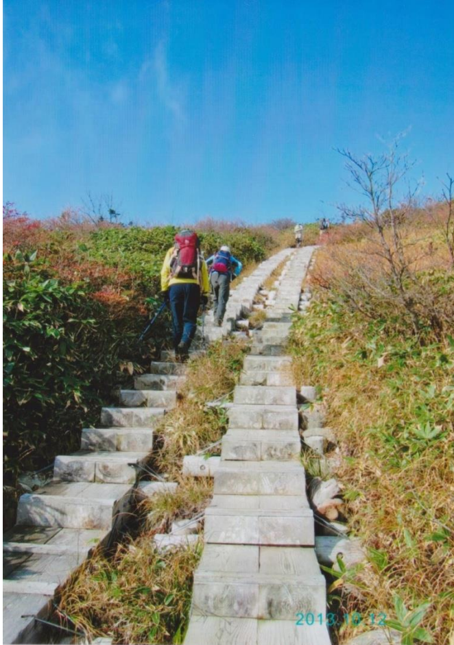
写真は苗場山(215m)新潟県 2013・10・12

には4, 5 m)。天保2年(1831年)安治川の土砂を積んで作られた人口の山で、2万5000分の一地形図の中で、最も低い山です。ちなみに10m未満の山は、全国に4山あります。仙台市の日和山(6, 0 m)、徳島市の弁天山(6, 1 m)、堺市の蘇鉄山(6, 8 m)。自然地形で最も低い山は日和山です。