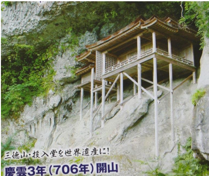
写真は 4 月 18 日開通した投入堂

投入堂は三仏寺の奥の院で三徳山(約 900 ㍓)の中腹にある。昨年 10 月 21 日に同町で震度 5 強を観測した地震では、ふもとの同寺から約 1 キロの参拝道の途中にある文殊堂(国重要文化財)の岩盤に長さ約 15 ㍓、深さ約 2 ㍓の亀裂が入り、入山を禁止した。(中略) 同寺の維持管理は入山料収入に頼っており、ツアーのキャンセルなどが相次いでいるため、CF による資金確保に着目した。(中国 2017・4・4)