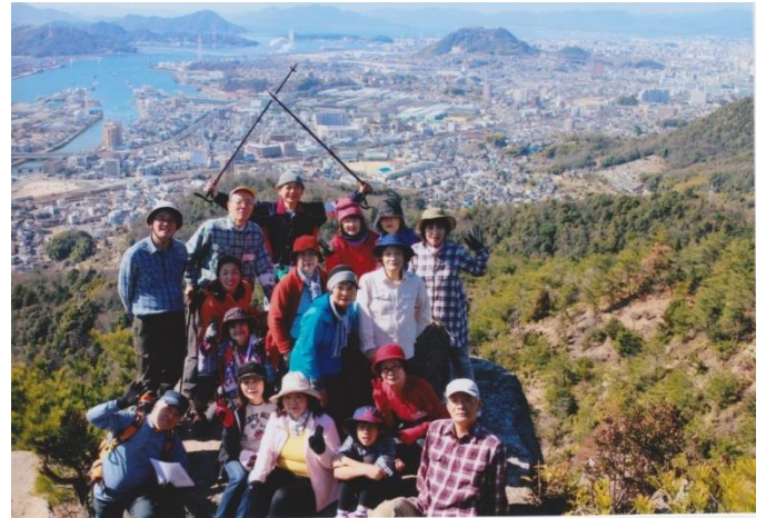
地獄岩にて海田湾を背景に 2017・2・19