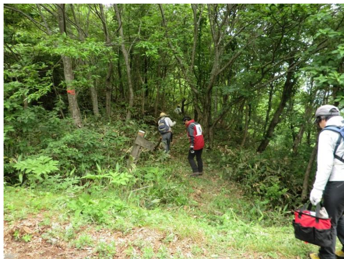
登山道整備の一コマ