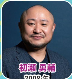
初瀬 勇輔 2008年 北京パラリンピック 柔道出場