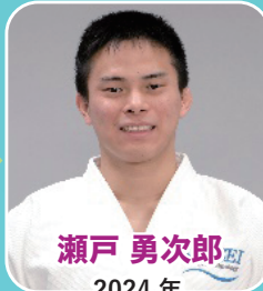
瀬戸 勇次郎 2024年 パリパラリンピック 柔道金メダリスト