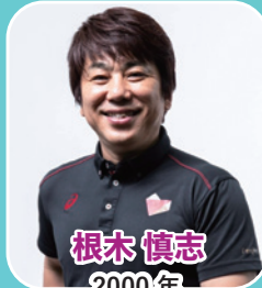
根木 慎志 2000年 シドニーパラリンピック 車いすバスケットボール出場